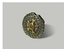
⑳全技連バッジ (直径1.4cm)