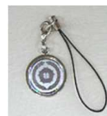
㉑全技連ストラップ