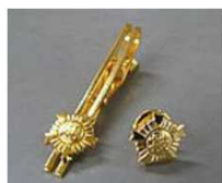
㉑技能士ネクタイピン ㉒技能士バッジ