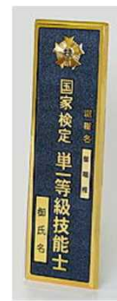
⑭単一等級 屋外用門標