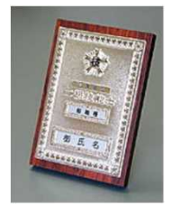
②特級 楯 店頭用(大) ⑤1級 楯 店頭用(大) ⑨2級 楯 店頭用(大) ⑥1級 楯 机上用(小) ⑩2級 楯 机上用(小)