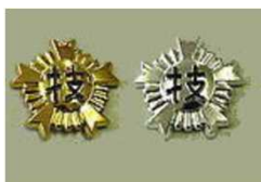
⑲ヘルメットマーク1級(金色) ⑲ヘルメットマーク2級(銀色) (直径4cm)