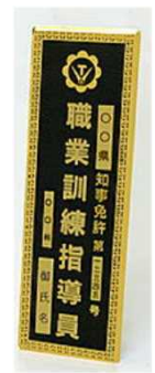
⑮指導員 屋外用門標