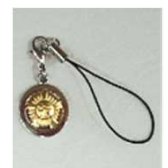
㉒技能士ストラップ